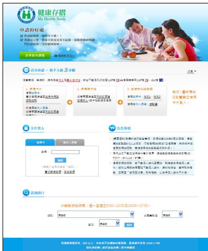
圖二、「健康存摺」系統首頁畫面。