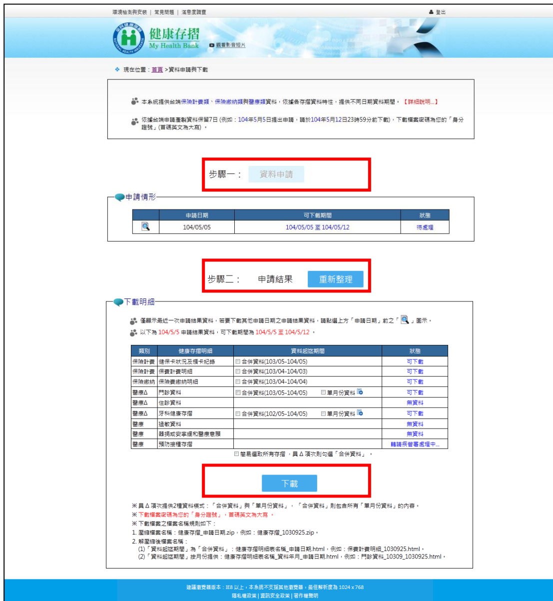
圖三、登入「健康存摺」系統後先點選「資料申請」，於 10 分鐘內再點選「重新整理」，即可查詢及下載申請結果。