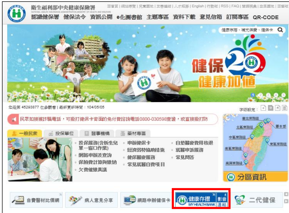
圖一、健保署官網「健康存摺」連結圖示。